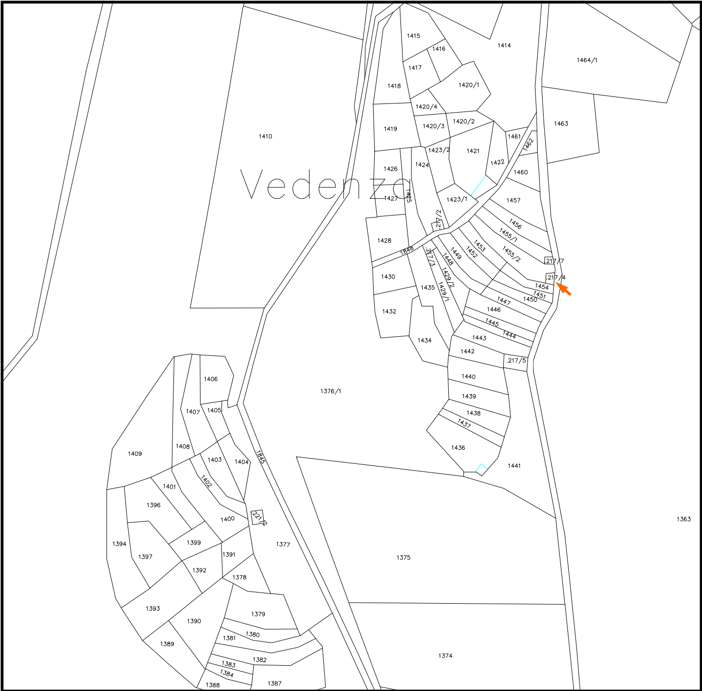
Mappa Catastale scala 1:2000